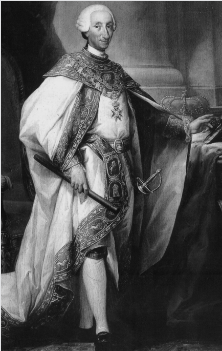
III. 10 Karol III. (1759-88) (Sánchez-Albornoz 1971, obálka)

Carlos III (1759-88), besides cutting down the overgrown power of the monastic orders, abolished much antiquated and restricting legislation and had infrastructural renewal carried out. He also went on the records as the king who compelled the people of Madrid to give up emptying their slops out of the windows or, for example, introduced Christmas cribs following Neapolitan models. The fact that he finally ordered the “Gypsies” to be freed from internment is practically unknown to the public.